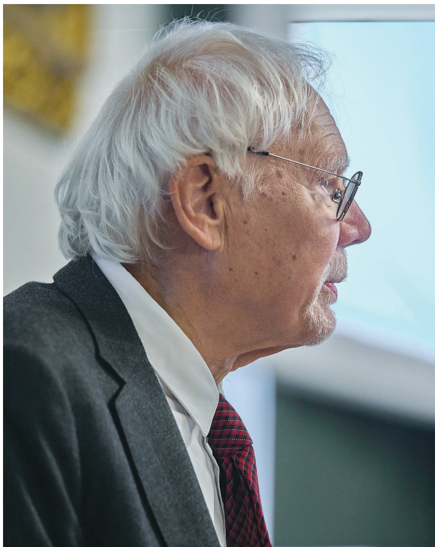
Prof. dr hab. Marek Safjan