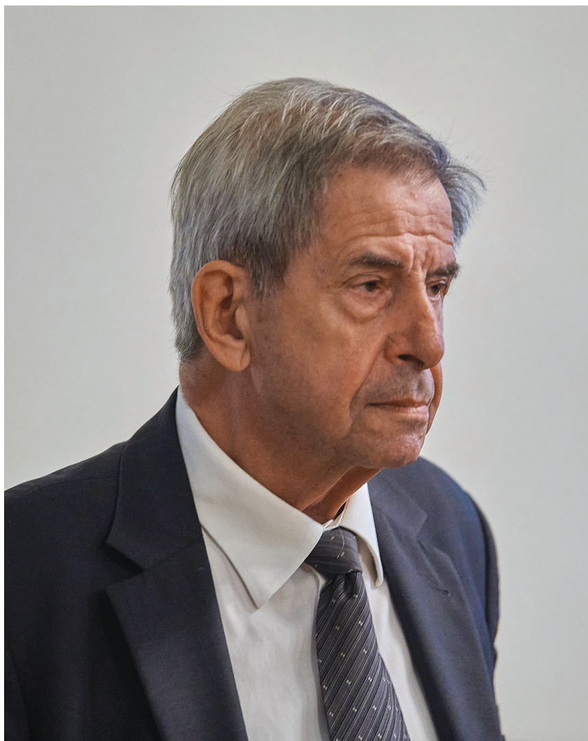
Prof. dr hab. Andrzej Zoll