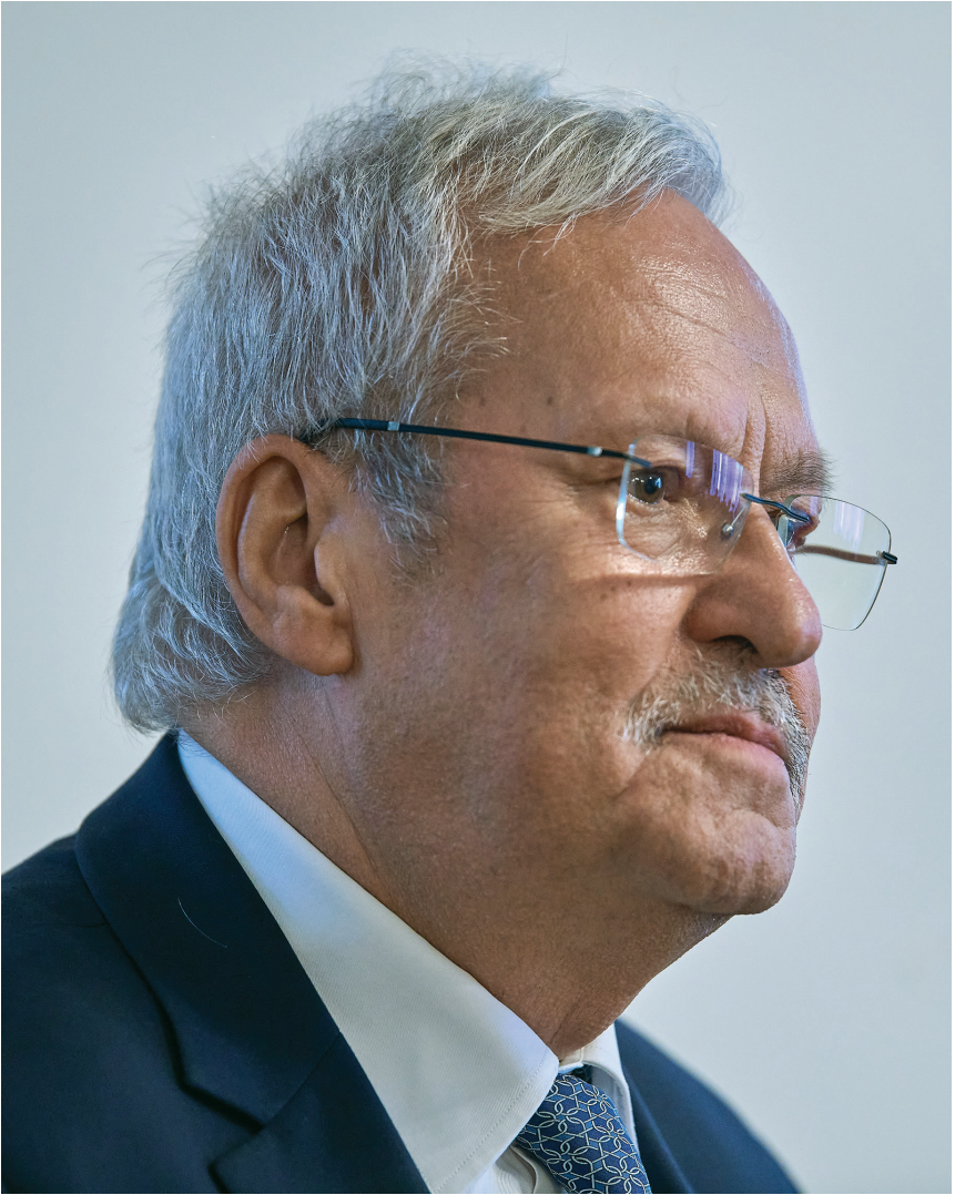
Dr Janusz Steinhoff