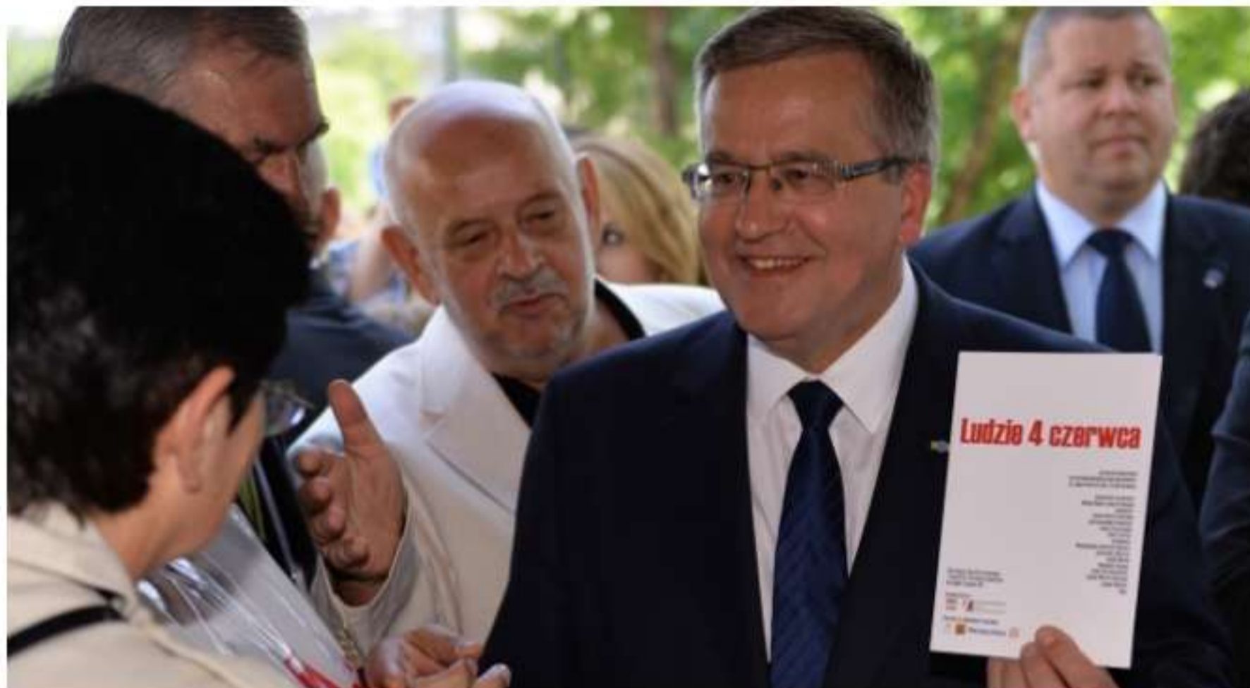
Prezydent Bronisław Komorowski

- 4 czerwca 1989 roku to wielkie, mądre, dobrze wykorzystane zwycięstwo - powiedział Bronisław Komorowski.