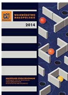
Województwo Małopolskie 2014